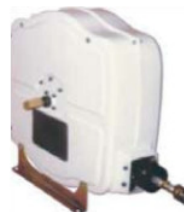
Mod. 465-83C Enrolladores Retráctiles Carenados