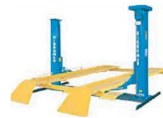
Elevadores de 2 y 4 columnas