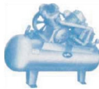
Compresores de Aire a Pistón A/B