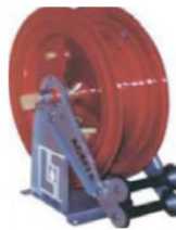
Mod. 465-83 Enrolladores Retráctiles Abiertos